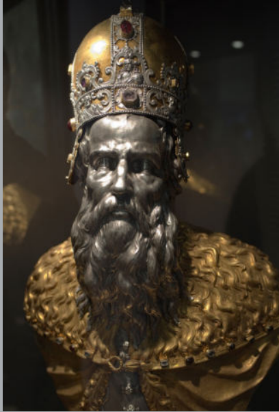
Szent István hermája.

Szent István 1635-ben, Rómában készült - 2021. december 6-g, a zágrábi székesegyház kincstárából kölcsönzött - különleges hermája, ereklyetartója a teremhez vezető folyosón. Talapzatát a korszak legnagyobb szobrásza és építésze, Giovanni Lorenzo Bernini készítette.