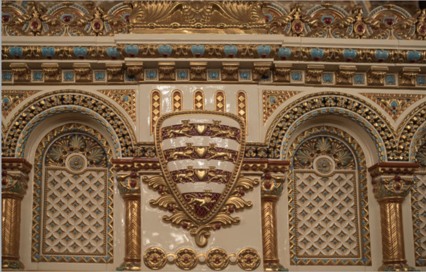
Zsolnay kandalló, részlet.

A kandalló tűztere feletti homlokzaton az Árpád ház címere jelenik meg.