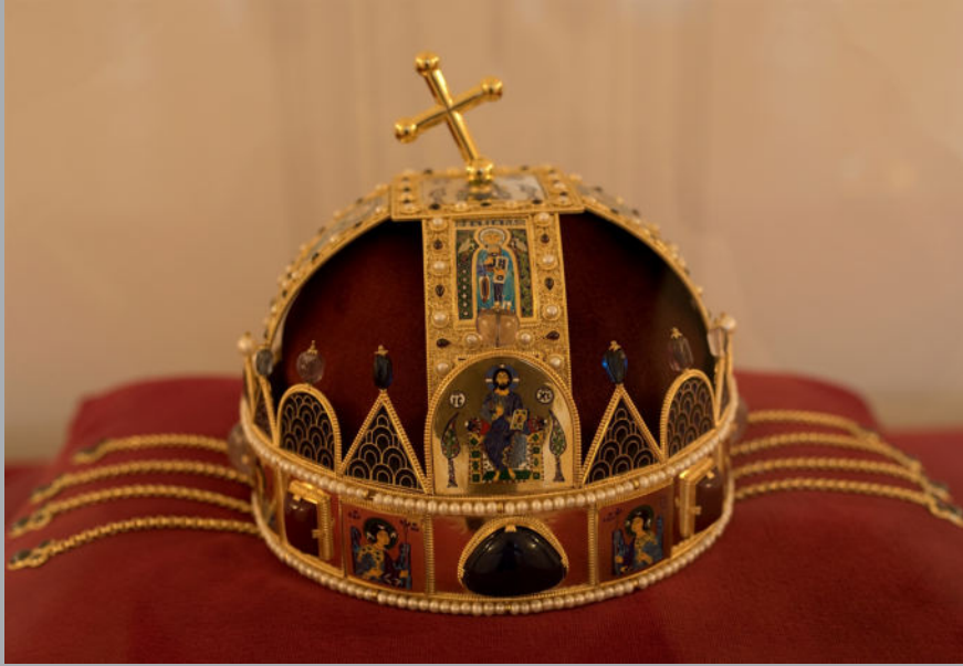
A Szent korona másolata .

A magyar Szent Korona egyik másolata a teremhez vezető folyosón. A Szent Korona Európa egyik legrégebbi beavató koronája a magyar államiság jelképe. A korona körülbelül 2 kg súlyú. Az alsó abroncsot görög koronának nevezik, mert képeit görög magyarázatok kísérik. A felső pántos részt latin koronának nevezik, a latin feliratok okán.