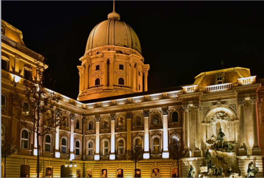
A Szent István terem szomszédságában a Hunyadi udvarban található Mátyás kút esti világításban.