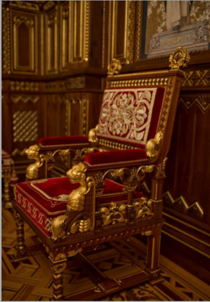
A bútorzat és parketta a teremben.

A kandalló két oldalán látható szalon-garnitúrák egyik karosszéke Thék Endre asztalosműhelyében készült.