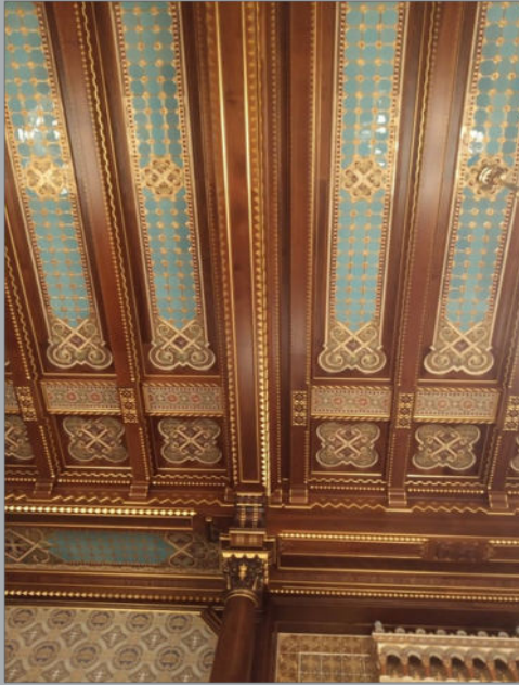
A Szent István terem mennyezete.

A mennyezet falbetéteinek korabeli másodpéldányai az egykori Zsolnay gyár épületeiben beépítve maradtak fenn. A falburkolatot és a terem mennyezetét a Zsolnay gyárban készített pirogránit elemek díszítik.