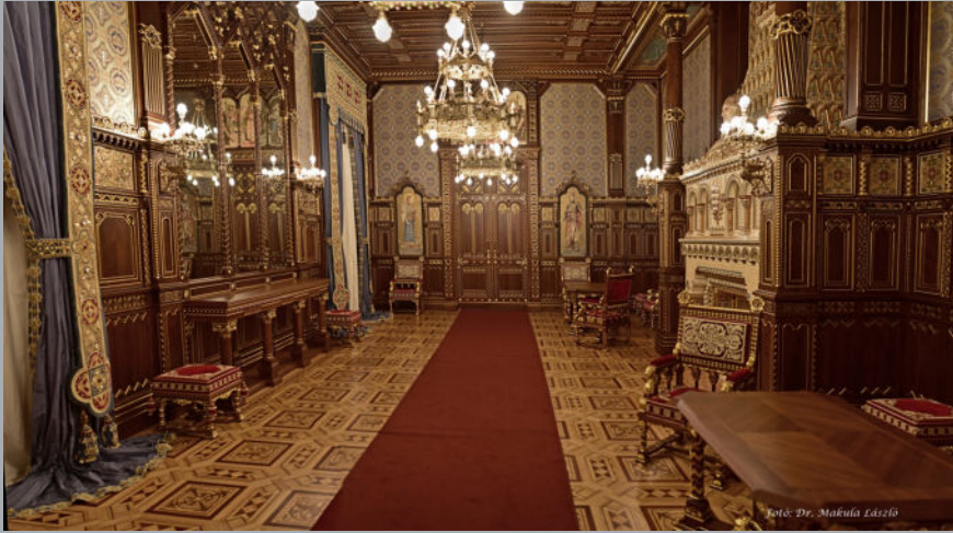
Szent István terem belső képe.

A román stílusban, Hauszmann Alajos tervei alapján készült és 1902. februárjában a Budavári Palota déli összekötő szárnyában, díszvacsora kíséretében átadott, és a rekonstrukció során bizonyos pontokon a magyar ornamentika elemeivel gazdagított Szent István terem, az újjászületett Budavári Palota csodája. Egyediségét a négy nemes alapanyag, a fa, a textil, a kerámia és a fém harmóniája adja. 1900-ban, Párizsban a Szent István terem megkapta a világkiállítás nagydíját.