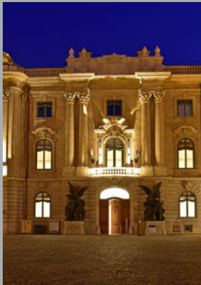
A Budapesti Történelmi Múzeum bejárata esti kivilágításban.

Séta a Budai Várban és annak ékkövében a Szent István teremben