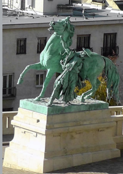
A Lovarda a Csikós udvaron.

A háború előtti lovarda újjáépített épülete, ma a Palotanegyed egyik rendezvényterülete.