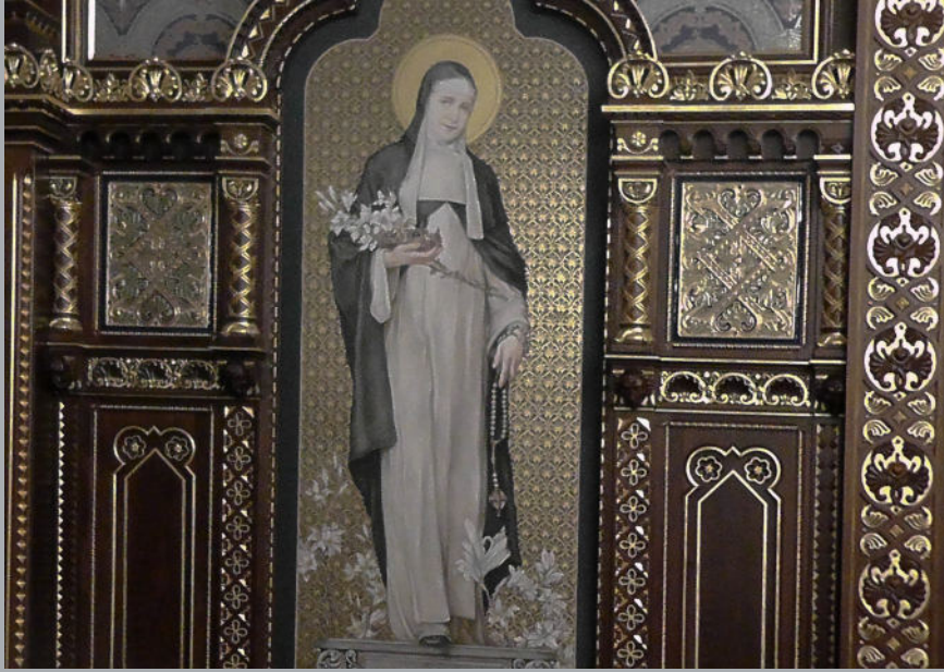
Szent Margit képe

Szent Margit (1242-1270) - IV. Béla király 8. lányának pirogránitra festett, anatómiai pontosságú képe.