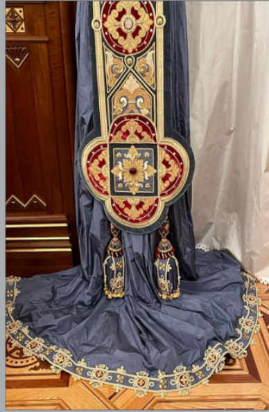
A Szent István terem falikárpitjai.

A terem falikárpitjai, függőnyeik, függönyszárai szövet- és fonatstruktúrái, azok hímzés- és szövés-technikai művészet-történések és restaurátorok kezeiben születtek újjá és megszólalásig az eredeti mintákat követik. A bojtokhoz és paszományokhoz csak 24 karátos, hernyóselyem aranszálakat használtak fel. ( https://szentistvanterem.hu/hu )