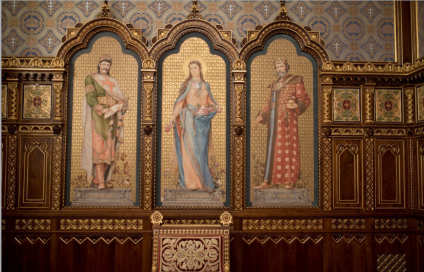
Árpádházi királyok és Erzsébet .