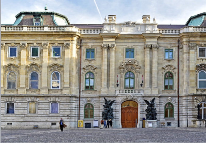
A Budapesti Történelmi Múzeum bejárata nappal. Itt található a Szent István terem.