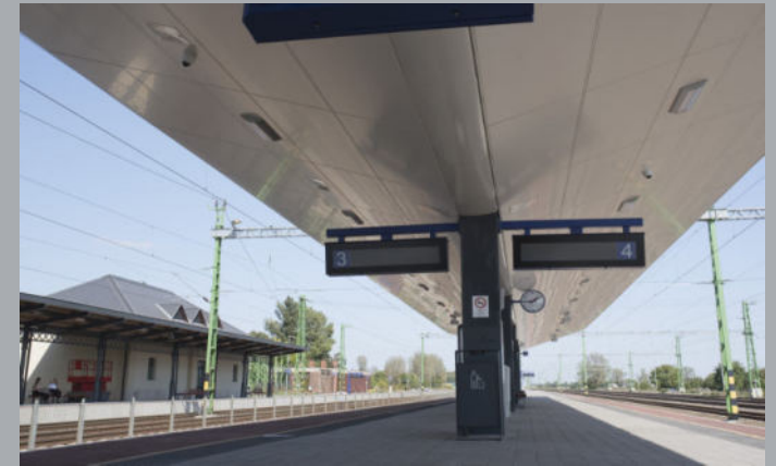
A 100-as vasútvonal korszerűsítése