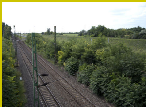
A 40-es vasútvonal korszerűsítése