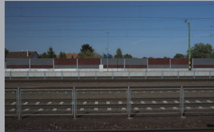
A 100-as vasútvonal korszerűsítése