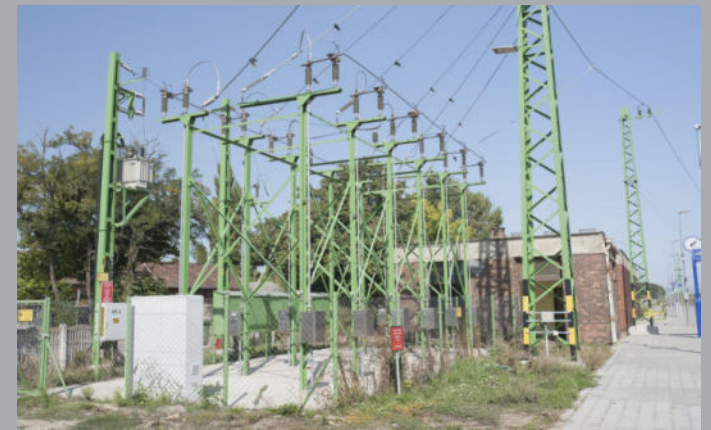
A 100-as vasútvonal korszerősítése