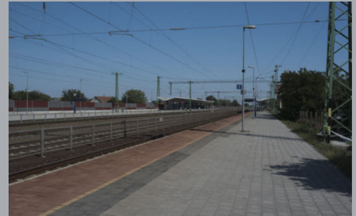
A 100-as vasútvonal korszerűsítése